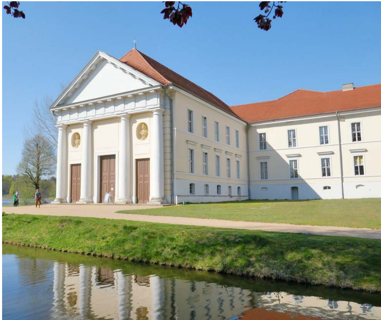
Rheinsberg: In die Sanierung des Schlosses flossen auch europäische Fördermittel.

Zum Beispiel in Rathenow mit seinem Optikindustriemuseum, das an die Anfänge der optischen Industrie erinnert. Mit EU-Mitteln wurde der Radweg entlang der Havel angelegt. In Stölln bei Rathenow erinnert