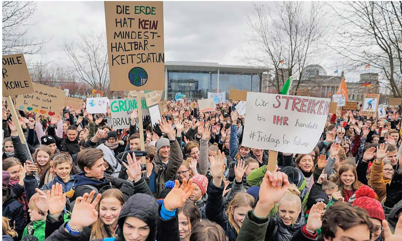
Freitags für die Zukunft: Weltweit demonstrieren Schülerinnen und Schüler seit vielen Wochen für Klimaschutz und eine lebenswerte Zukunft.

Ihr Michael Müller Regierender Bürgermeister