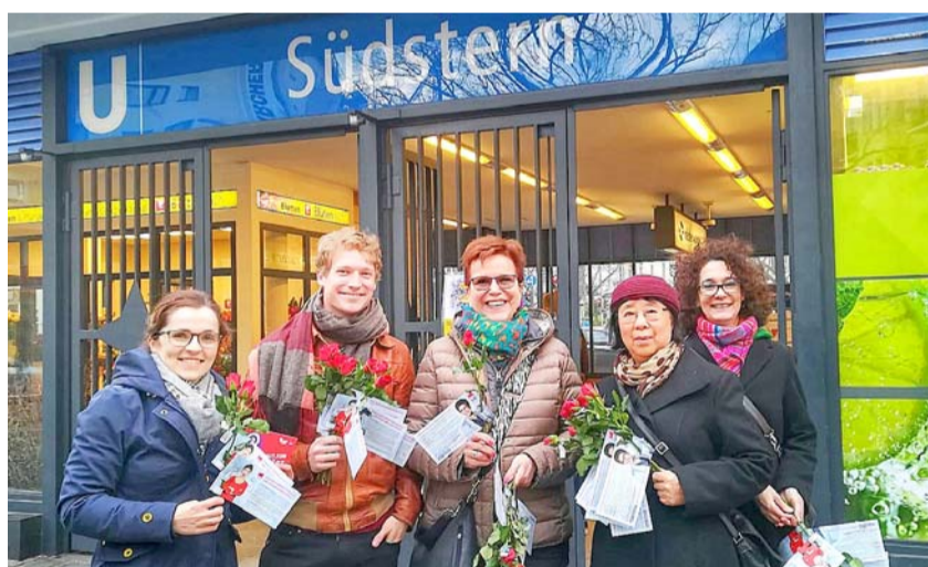
Unterwegs in Berlin: Gaby Bischoff bekommt viel Unterstützung für ihren Traum von einem Europa der Freiheit, der Teilhabe und der sozialen Gerechtigkeit. Hier von der SPD Südstern.